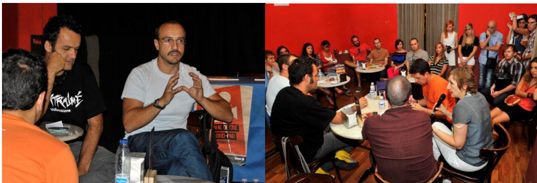
Dos momentos diferentes del debate en el Café Galdós.

descargar sin pagar y eso nos daña a todos porque incluso hace que las productoras no crean en ti”.