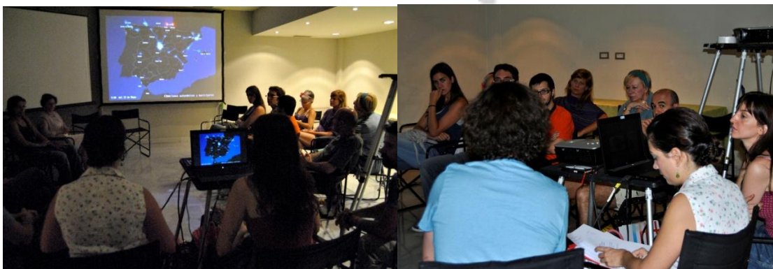
Dos momentos del ciclo Experimenta el nuevo cine.

El primer momento para la reflexión fue la segunda sesión del ciclo paralelo Experimenta el nuevo cine, dirigido por Ana Solano. El objetivo principal era poder compartir diferentes ideas sobre la fuerza de resistencia que posee el audiovisual dentro de los dominios institucionales de poder, y hasta qué punto las corrientes actuales y las nuevas formas de narrar son excluidas de los circuitos de distribución y exhibición.