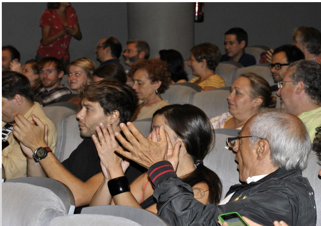
El público asistente aplaudió entusiasmado las proyecciones

Por la noche, fue el estreno de la Sección oficial PNR. Este ciclo es el único exclusivamente para los socios de la Plataforma y en la primera sesión se pudieron disfrutar las piezas: "Peniela", "Odio", "La dantesca escena", "2º Piso", "No existe el adiós", "El despegue del trimotor" y "Alergia".