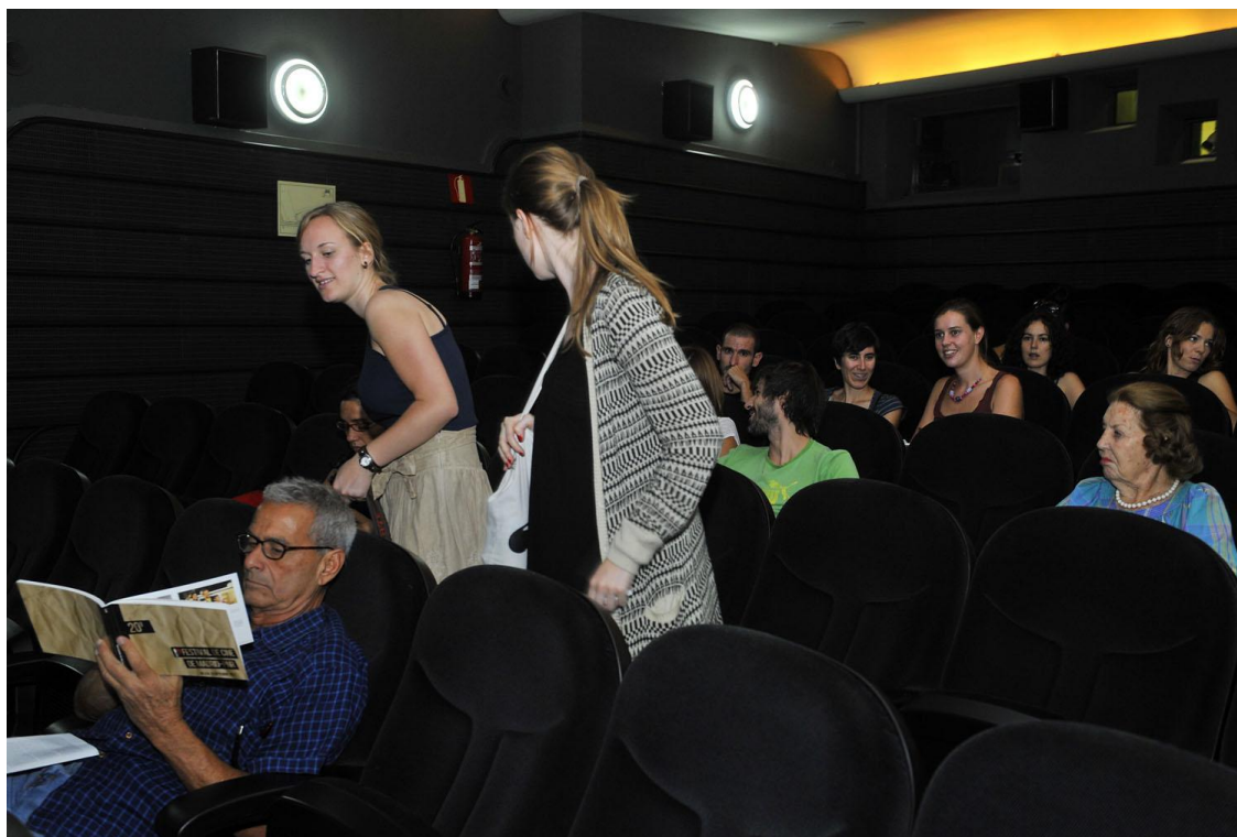
Público acomodándose para el pase de Cine Posible en el Cine Doré

Mañana se proyectará el último ciclo paralelo que aún queda por exhibirse correspondiente a “La Mancha en Femenino”, una oportunidad de apreciar el talento de las creadoras de esa región con el pase a las 17h en el Cine Estudio de las obras, “El último veraneo”, “Estrella”, “Las hormigas acuden puntuales a las citas”, “No name” y “Test”.